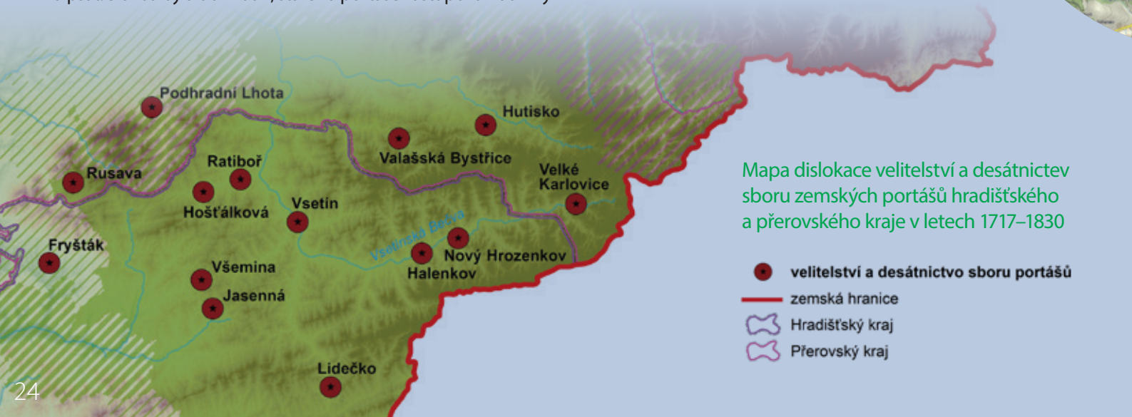
Mapa dislokace velitelství a desátnictev sboru zemských portášů hradištského a přerovského kraje v letech 1717–1830