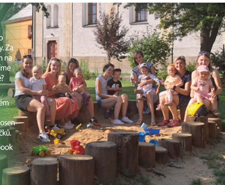
Foto z táborů...