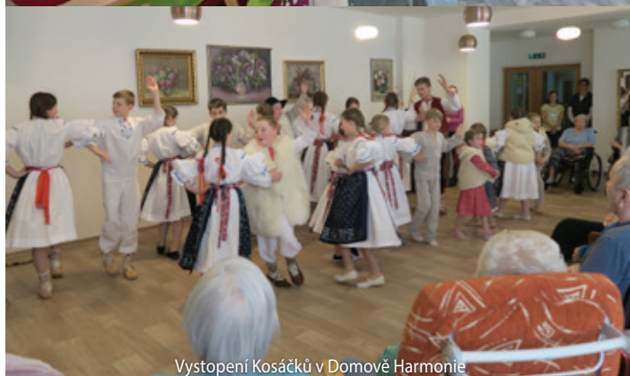
Vystoupení Kosáčků v Domově Harmonie