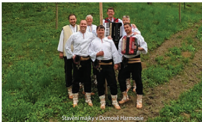
Stavění májky v Domově Harmonie