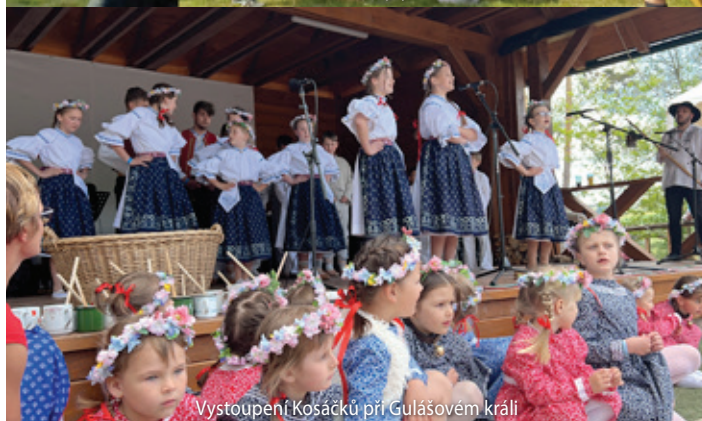
Vystoupení Kosáčků při Gulášovém králi