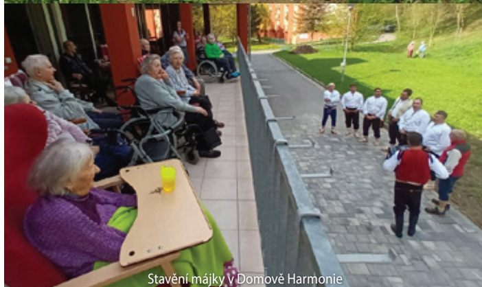
Stavění májky v Domově Harmonie