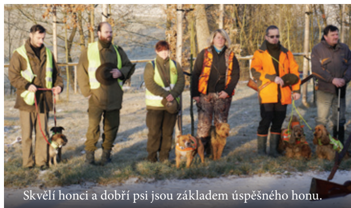
Skvělí honci a dobří psi jsou základem úspěšného honu.