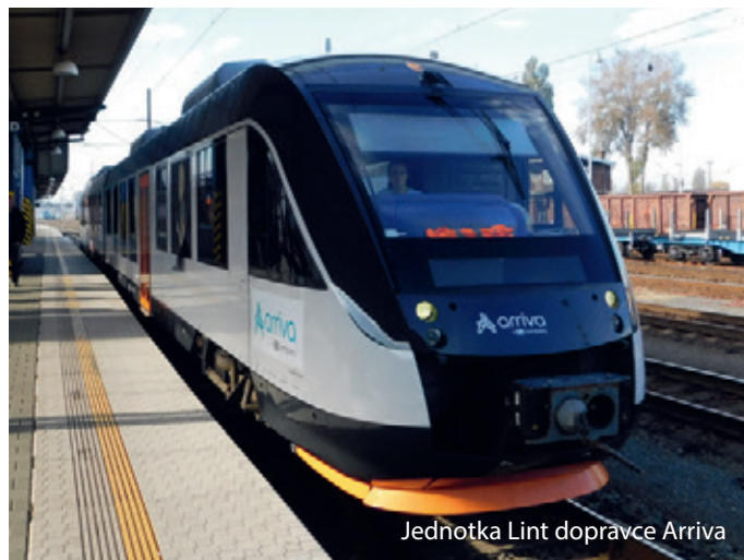
Jednotka Lint dopravce Arriva