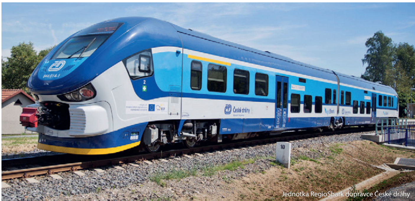
Jednotka RegioShark dopravce České dráhy

V případě, že jste zde nenašli dotaz, který vás zajímá, můžete se s ním obrátit na společnost Koordinátor veřejné dopravy Zlínského kraje, kontakty najdete na www.id-zk.cz . Dotazy je možno posílat také na e-mailovou adresu info@koved.cz .