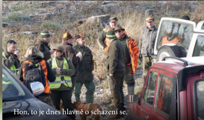
Hon, to je dnes hlavně o scházení se.