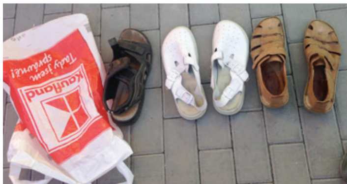
Plastový pytlík s botami vhozený do kontejneru s papírem! Kdo v nich asi chodil?

Přátelé, kamarádi sousedé, spoluobčané. V Ratiboři třídíme odpad již od roku 1987 a pro některé se stal samozřejmou součástí dennodenních povinností a rituálů. V současné době zažíváme velký rozvoj v této oblasti. O další kvalitativní úroveň se zvýšily možnosti Sběrného dvora, o čemž svědčí nejen jeho fyzický stav, ale i rozšíření provozní doby ze dvou na tři dny v týdnu. Zároveň se obec prozřetelně zapojila do nového programu připraveného Ministerstvem životního prostředí pod názvem Obec bez odpadu, který zvýší motivaci lidí ke třídění odpadu (viz Prázdninový Zpravodaj 2019/2 s. 4). Na rozdíl od současného stavu ale bude tento program vyžadovat podstatně vyšší disciplínu zapojených účastníků. Nebude totiž možné, aby se v pytlích s papírem vyskytoval jiný odpad, než papír, a v pytlích s PET lahvemi jiný plast či dokonce komunální odpad, jak se to stále stává v kontejnerech na tříděný odpad, umístěných po dědině. Zde jen pár ukázek z konce srpna a začátku září zachycených namátkou v kontejnerech „U Jednoty“.