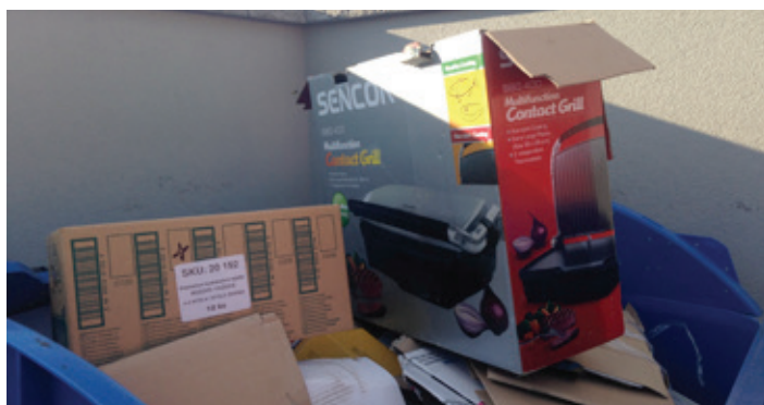
Pět takových krabic a kontejner je plný. Přitom stačí tak málo!

S leností také souvisí přeplněné kontejnery na papír. Všimněte si, kolik prázdných krabic nejrůznějších rozměrů dokáže zaplnit kontejner, a přitom je to jen papírem obalený vzduch. Když už se nenajde trochu času, aby se krabice roztrhala na 2 – 4 díly, které se do kontejneru uloží, zkuste tu krabici sešlápnout, podupat, aby zabírala co nejméně místa.