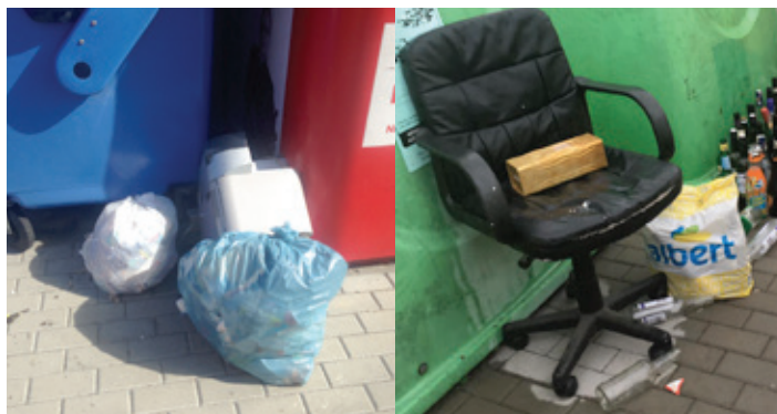
Modrý plastový pytel s komunálním odpadem, který měl skončit v klasické popelnici byl vhozen do kontejneru s plasty, bílý pytlík s tetrapekovými krabicemi, plastovým odpadem a papírem byl v modrém kontejneru na papír. Za nimi nefunkční kávovar, který měl skončit ve Sběrném dvoře stejně jako kancelářské křeslo.

Vedle ignorace rozřazení, respektive nesprávného rozřazení recyklovatelného odpadu, mi hýbe žlučí lenost odvézt velkoobjemový odpad, elektrické přístroje a nebo kovový odpad do Sběrného dvora. A tak se během výše zmíněných 14 dnů na přelomu srpna a září u kontejnerů objevila matrace, pytel s hardy a jiným komunálním odpadem patřícím do popelnice, vysloužilé umělohmotné žaluzie a několik elektrických přístrojů, které se nevešly do kontejneru na elektrický a elektronický odpad. Tyto věci pak musí do Sběrného dvora odvézt pracovní četa, kterou ale obec nezřídila za účelem eliminovat lenost některých z nás.