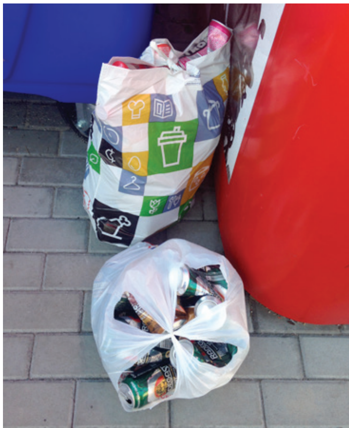
Barevná igelitka s plastovými, plechovými a papírovými obaly v kontejneru na papír, bílá igelitka s plechovkami od nápojů našťastí položená na zemi vedle kontejneru.