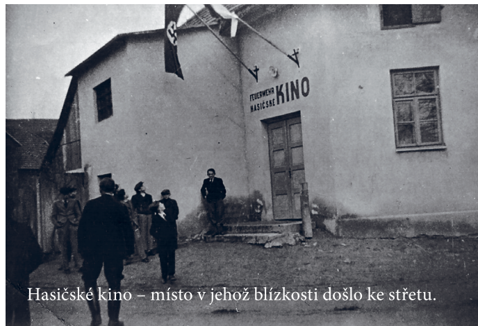
Hasičské kino – místo v jehož blízkosti došlo ke střetu.