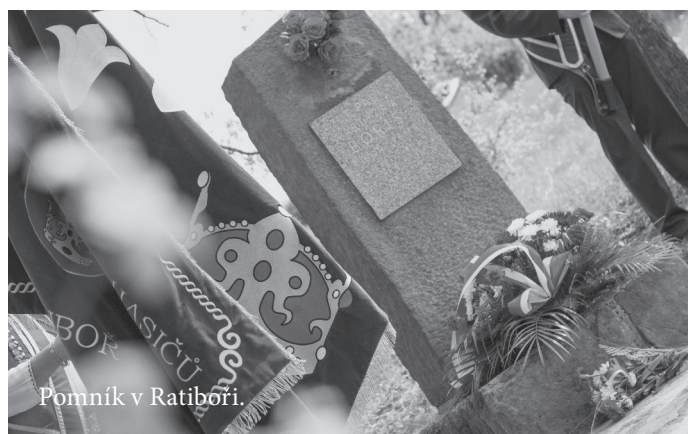
Pomník v Ratiboři.