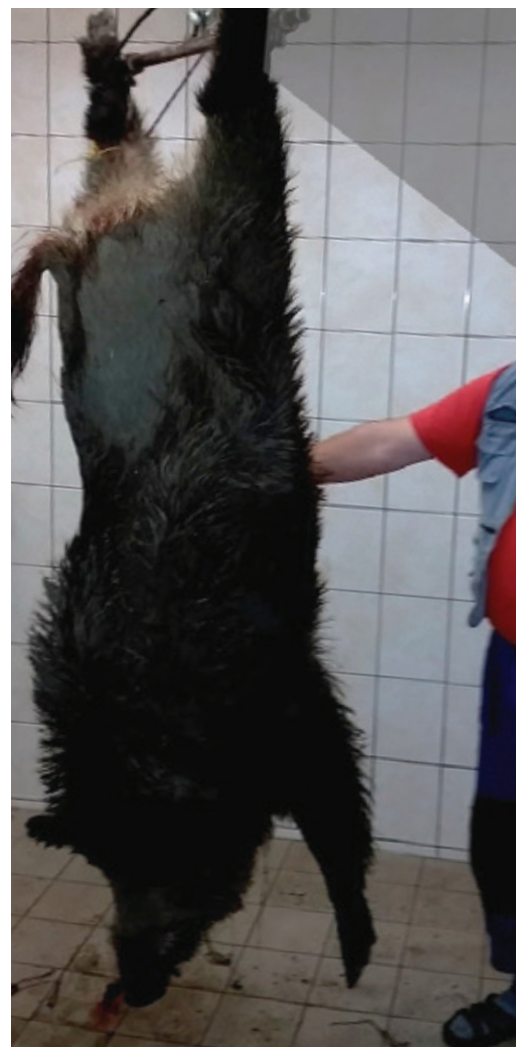
Tento divočák byl stražen dne 16. 10. 2014 u Prefixu (váha cca 150 kg).