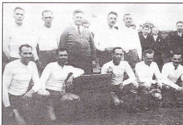
"Staří páni" z roku 1946. Poznáte je?