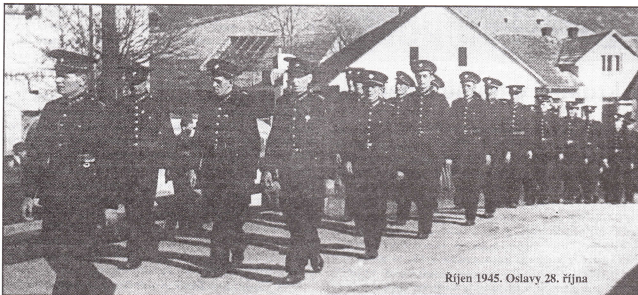
Říjen 1945. Oslavy 28. října