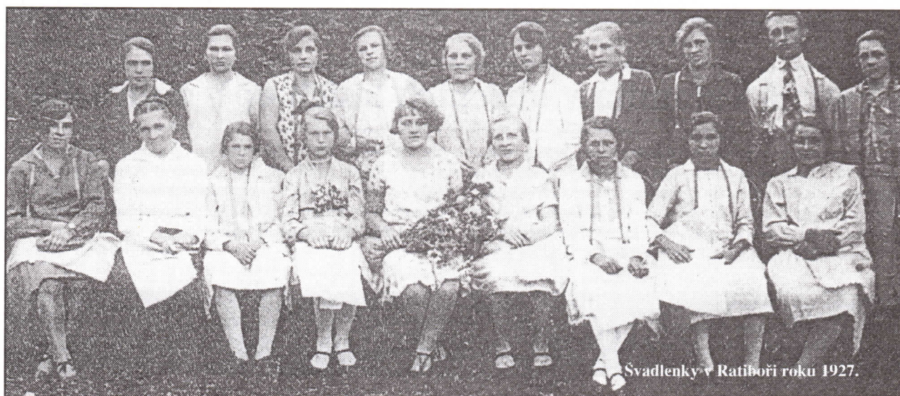
Svadlenky v Ratiborči roku 1927.