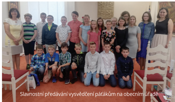
Slavnostní předávání vysvědčení pátákům na obecním úřadě

Letní prázdniny jsou nejkrásnějším obdobím nejen pro naše žáky. Přejeme proto všem klidnou dovolenou a slunečné počasí. Najděte si pro své děti dostatek příležitostí k prožití hezkých společných chvil a věnujte pozornost jejich bezpečnosti, abychom se všichni na začátku nového školního roku ve zdraví setkali.