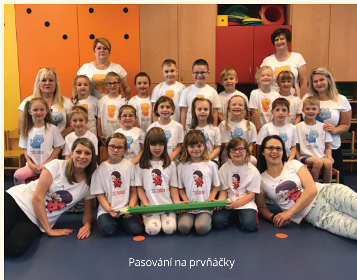
Pasování na prvňáčky

Slavnostní ceremoniál pro nastávající prvňáčky – pasování, proběhl v pohybové místnosti. Složení slibu školáka, předávání upomínkových předmětů, knih, triček se symbolem třídy, podpis do pamětní listiny a pasování velkou tužkou na zadeček však nechyběl. Učitelskému sboru ukápla nejedna slzička. Jsme rádi, že si všechny děti poněkud zvláštní školní rok užily.