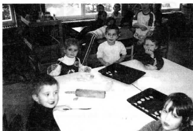
Mikulášské pečení u „Kotátek“.