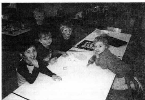
Mikulášské pečení u „Medvídků“.

Hodně zdraví, štěstí a osobní pohody v příštím roce přeje všem Zdeňka Březovjácová