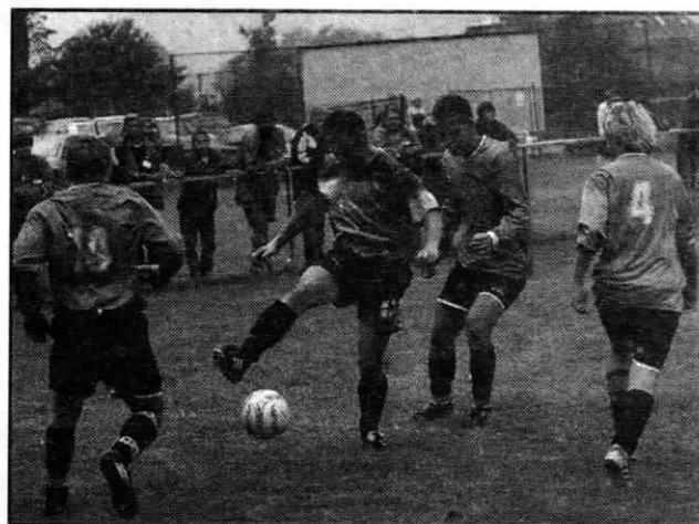
Momentka z utkání.