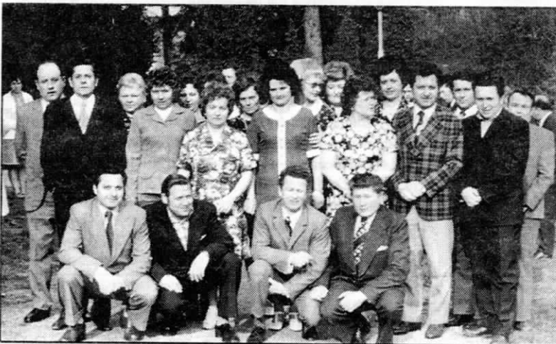
◀ Společné setkání ročníku 1939