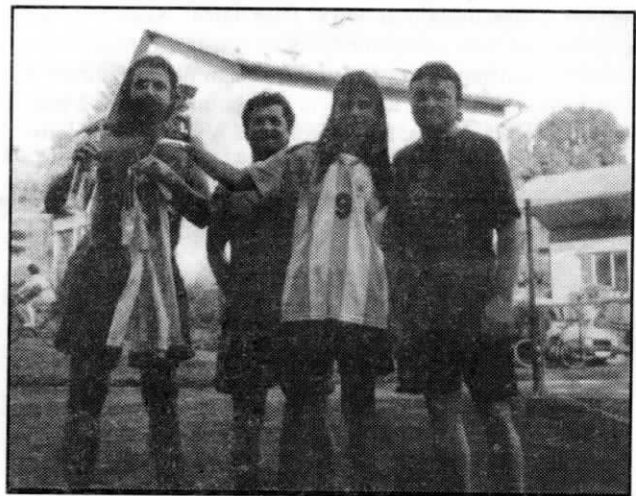
Vítězové II. turnaje