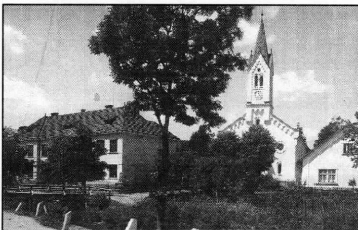
Pohled na školu a kostel v 50. letech.