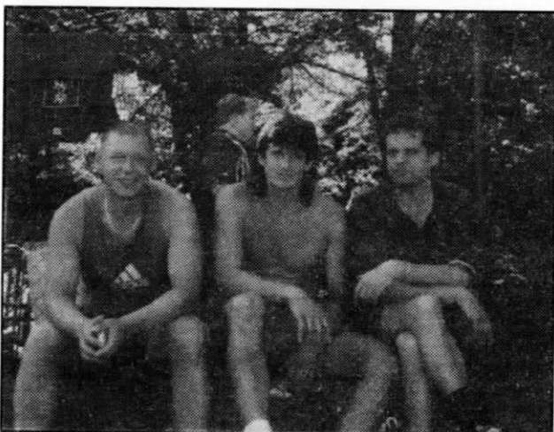
Vítězové I. turnaje