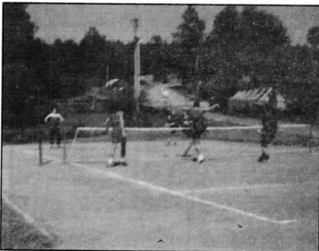
Z nohejbalového zápasu „Na Chmelnicích“