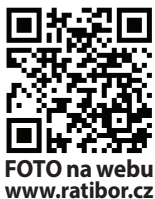
FOTO na webu www.ratibor.cz

Na všechna vystoupení se přišlo podívat téměř 500 diváků. Doufáme, že se vystoupení všem líbila a těšíme se na setkání při dalších akcích. Více informací a fotek/videí najdete na obecním webu: www.ratibor.cz/obec/fotogalerie